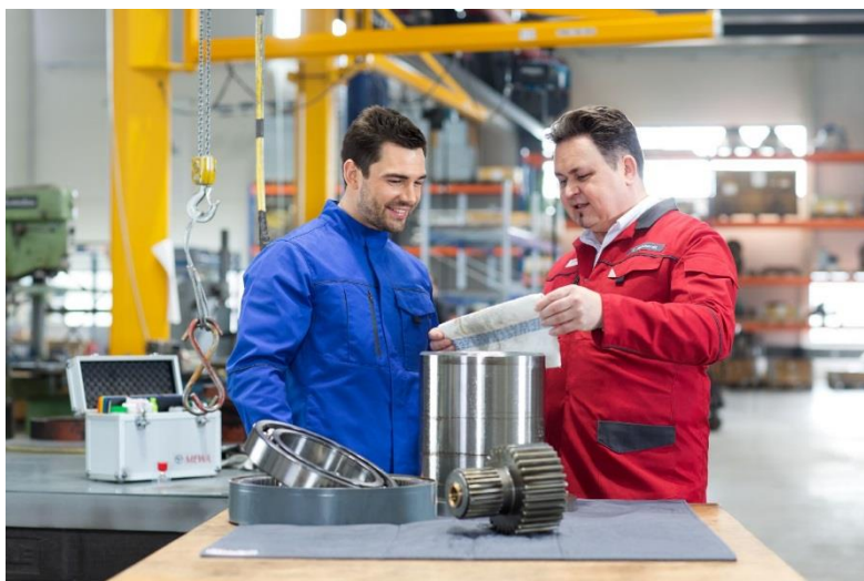
Un assessor comercial de MEWA mostra els diferents draps i característiques