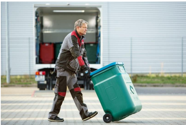
MEWA recull i entrega els seus draps de neteja als contenidors de seguretat SaCon®