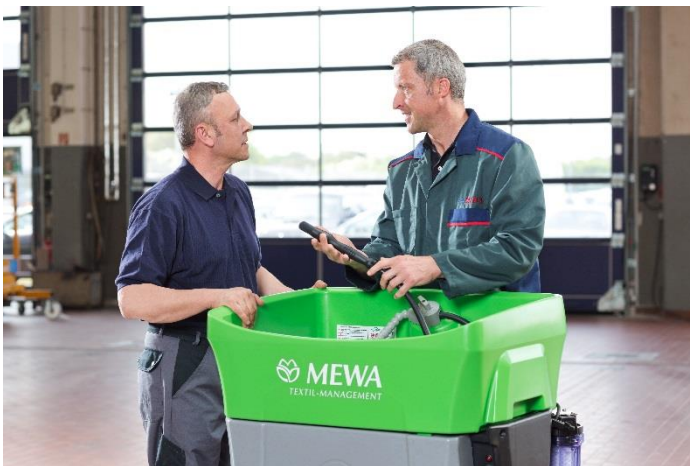
Un assessor de MEWA atén un operari del rentapeces Bio-Circle